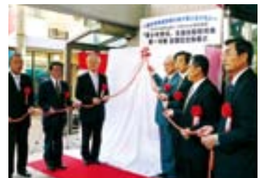
青少年育成支援自販機