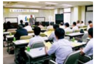
第1回フリーセミナー