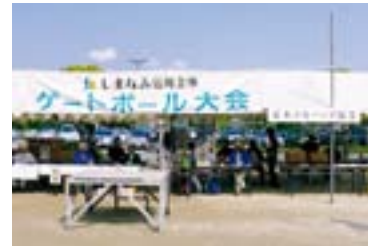
ゲートボール大会