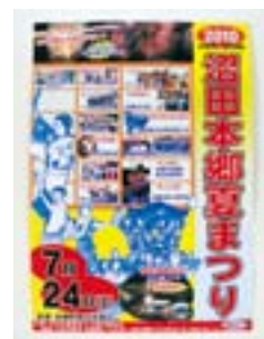
沼田本郷夏まつり